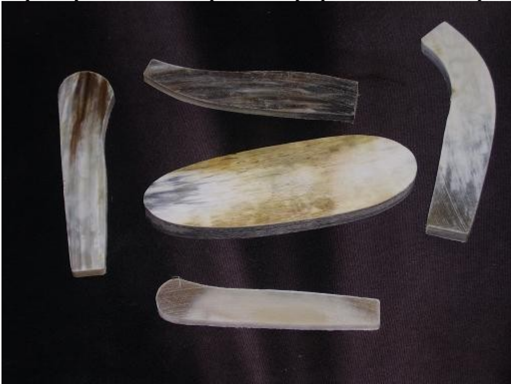
Plaquettes creux de corne façonnées