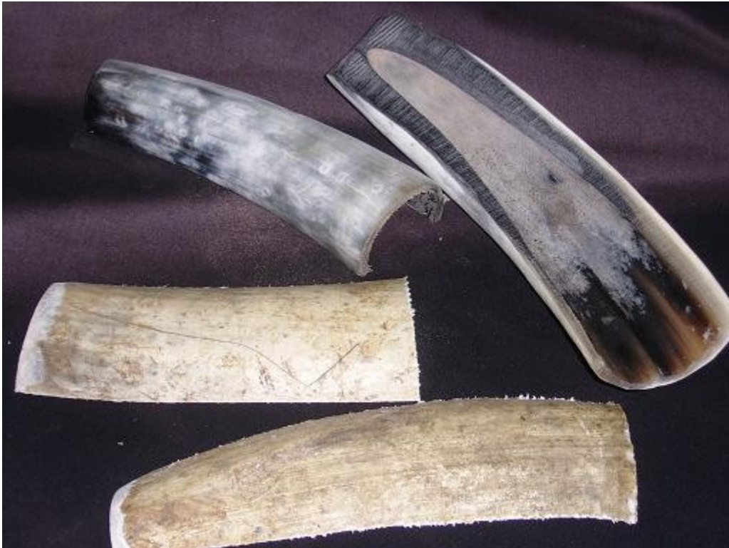
Creux de corne de bovin coupés