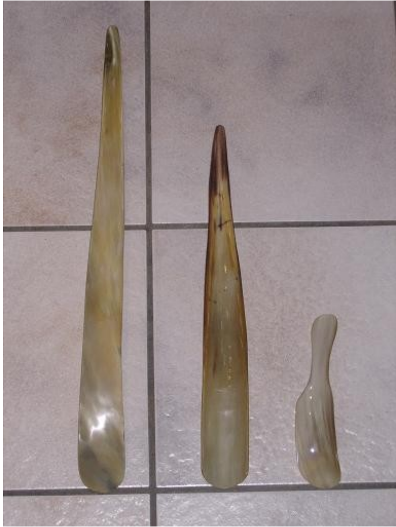
Chausse pied 60cms, 40cms, 20cms