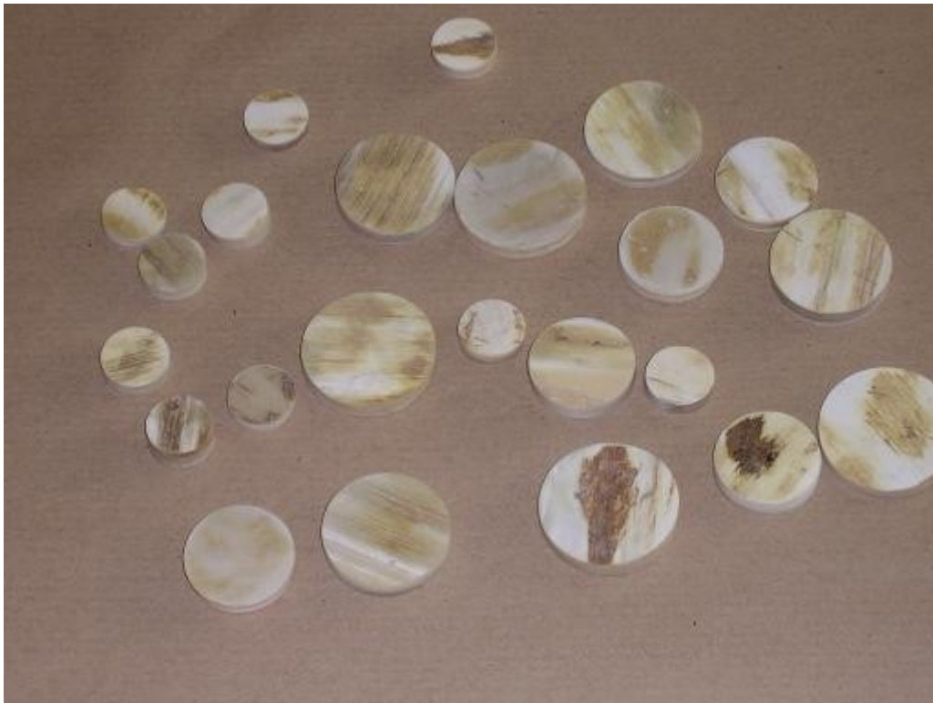
Pions creux de corne pour le tournage de boutons