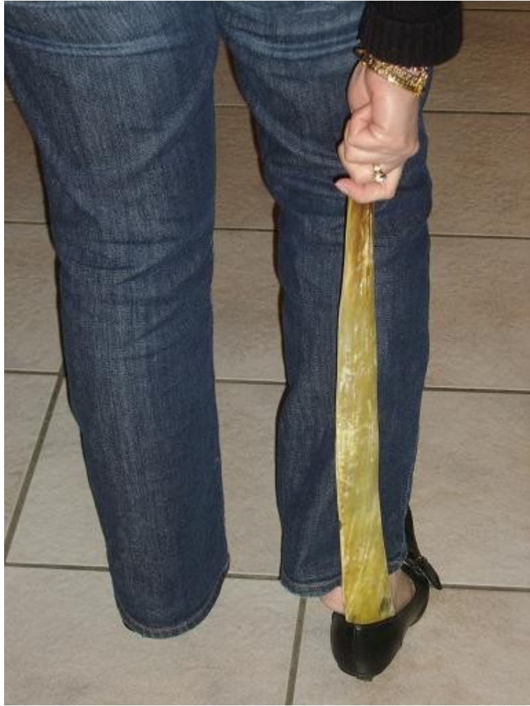
Chausse pied 60cms, pratique, pas besoin de se baisser