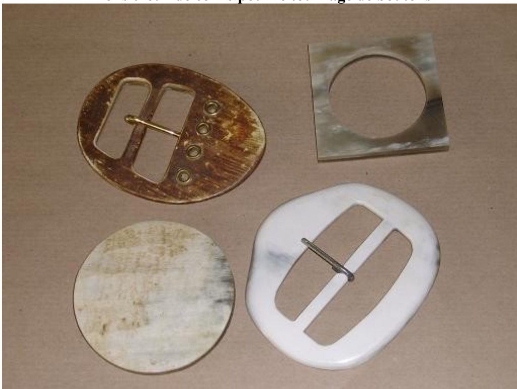
Boucle de ceinture, pion , rond de serviette en creux de corne